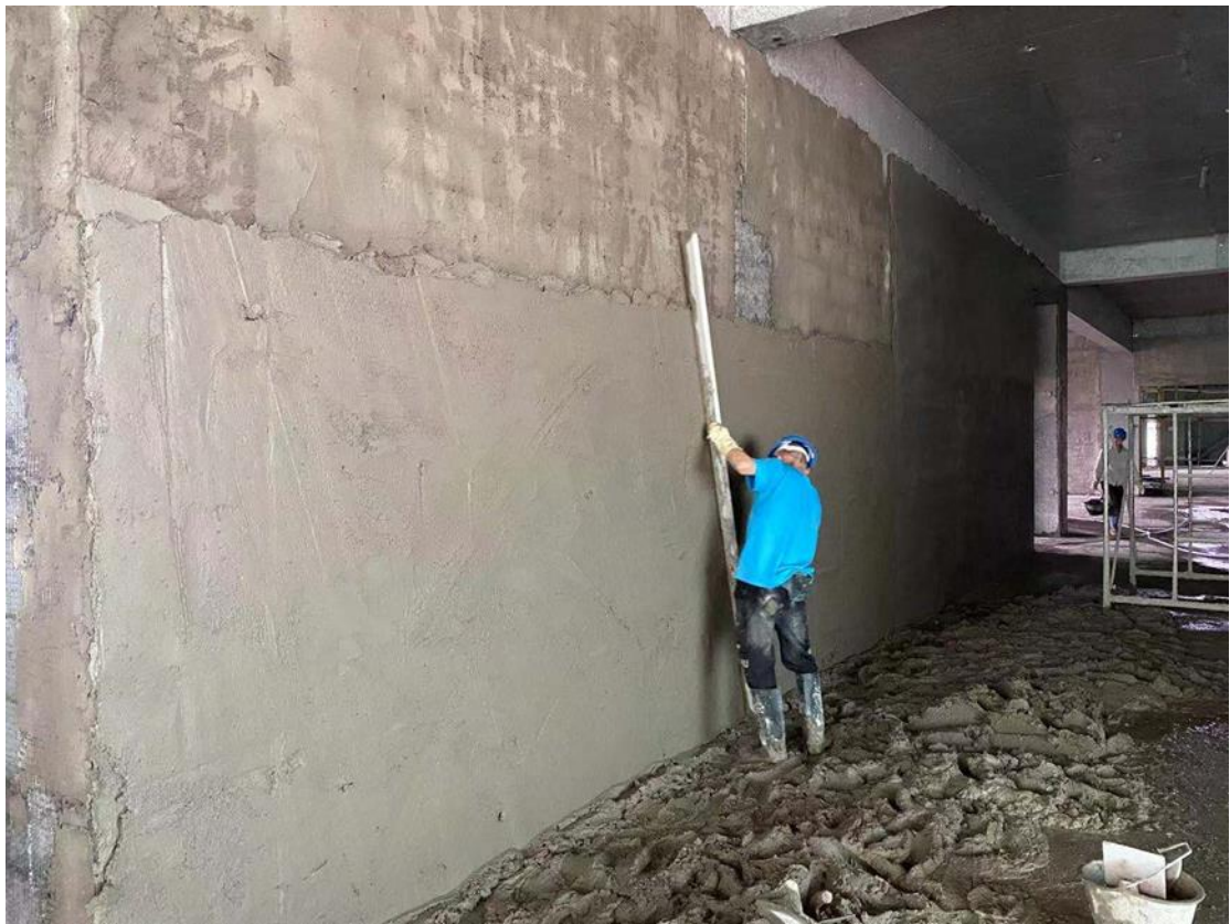
内墙抹灰施工精细化控制

建筑装饰工程室对结构工程的保护，室对建筑产品的完善，是建筑产品艺术性的充分体现。装饰工程的质量直接影响到建筑产品的质量，是创建精品工程过程及质量控制的重点和难点。应控制装饰工程质量达到美观、实用、不空不裂、平齐归一、施工精细。