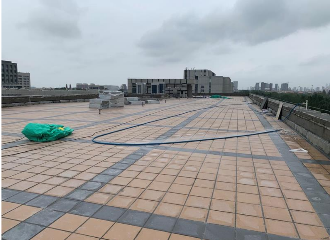
屋面缸砖铺贴完毕

建设项目管理始终坚持以关键部位、关键环节的质量控制为重点，在施工现场的质量控制过程中，建立质量保证体系，完善质量控制体系，加强质量管理意识，对施工过程中的关键部位、关键环节需要重点进行把控，严格执行“三检制度”，牢固树立质量意识，建立健全过程质量管理体系，严格加强施工过程中的自检、互检和交接检工作。坚持“预防为主，防治为主”原则，坚持技术措施先行的质量控制方法，自觉抓好过程质量，确保工程总体质量。同时严把材料质量关，材料进场确保监理查验，按规定进行抽样，实体检测均有监理单位旁站监督，质量合格。