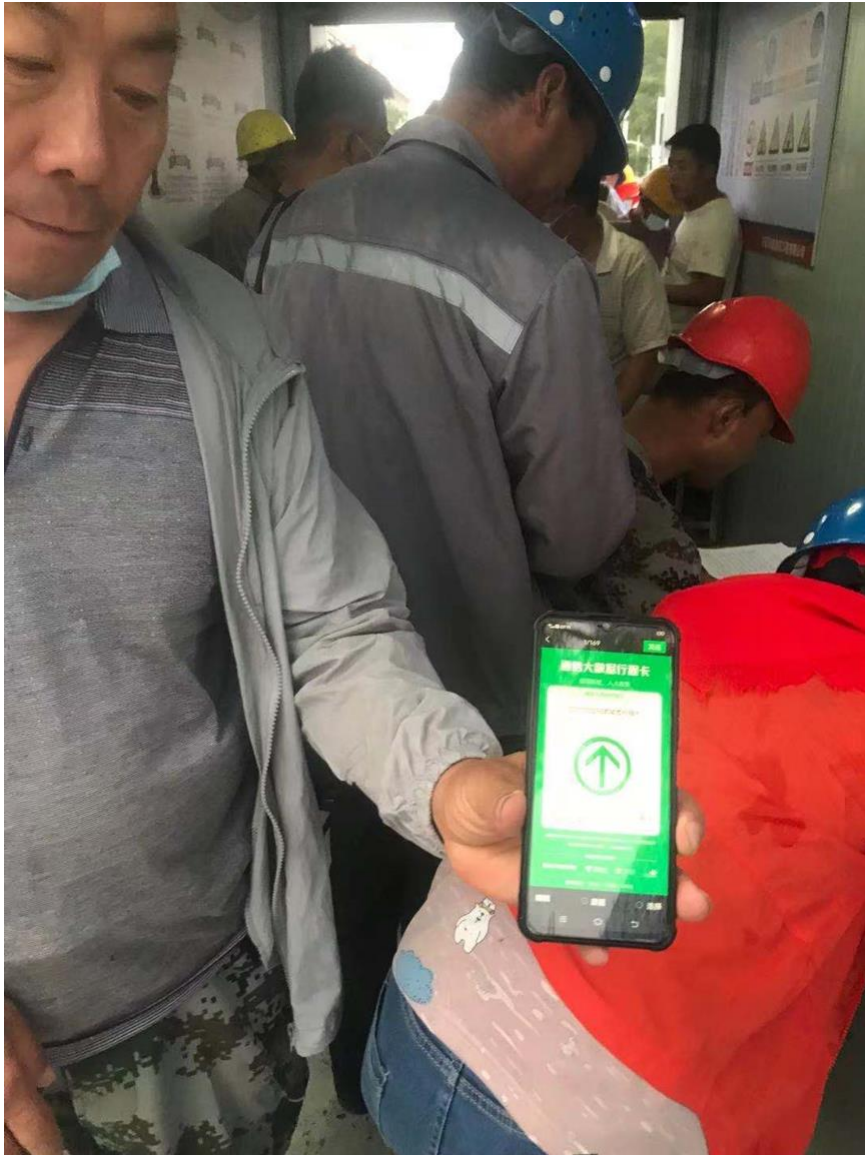
防疫期间加强门禁出入人员管理