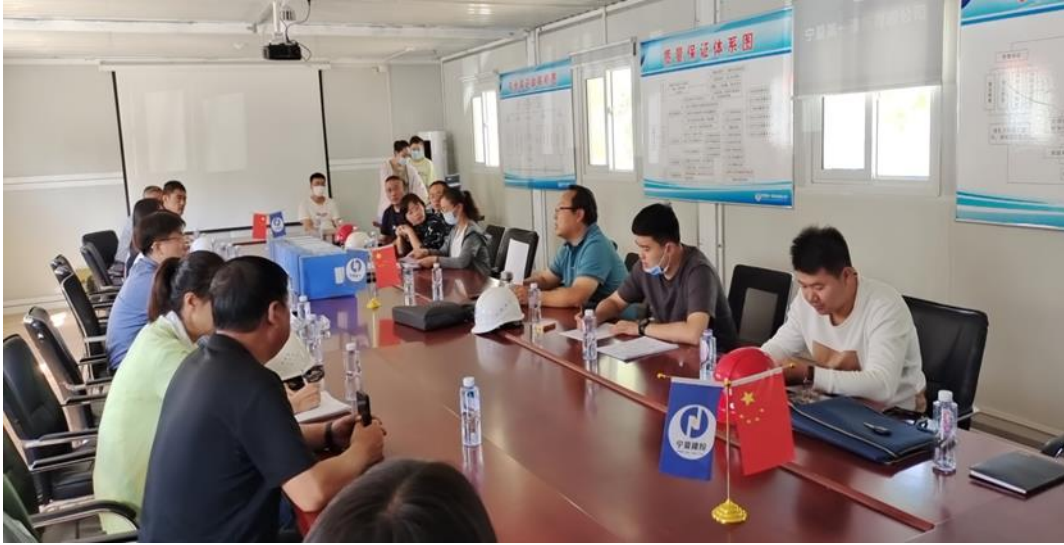
顺利通过银川市安全标准化工地检查验收