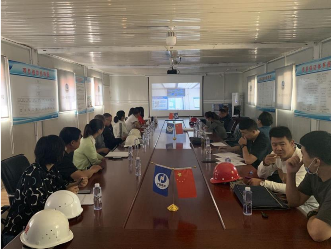
迎接宁夏工商职业技术学院拟建实验楼至项目考核