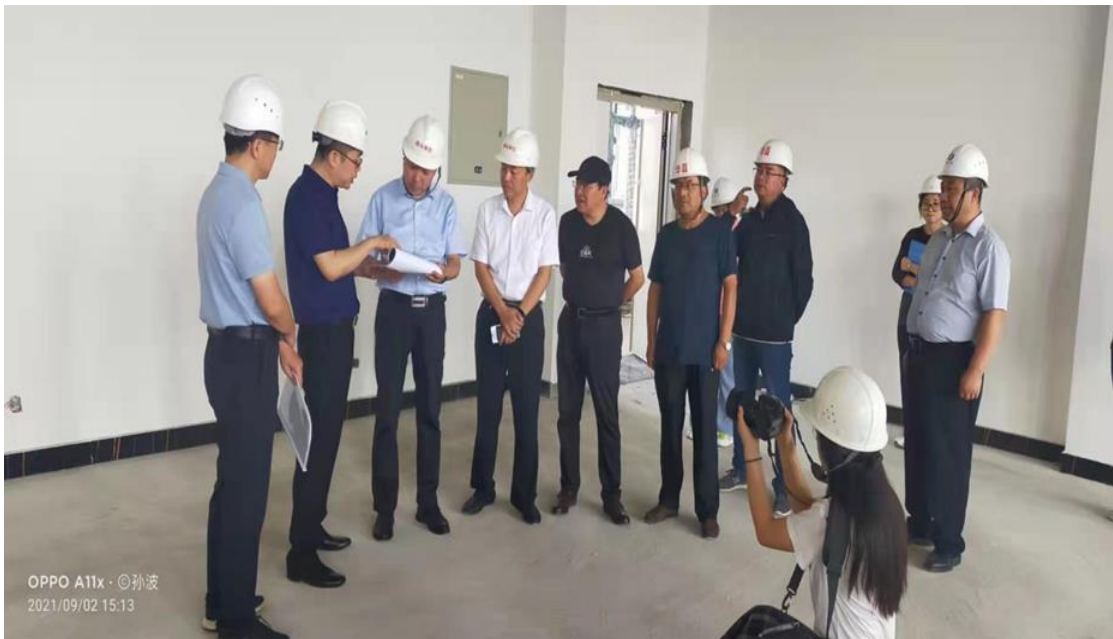
自治区党委宣传部视察项目建设情况