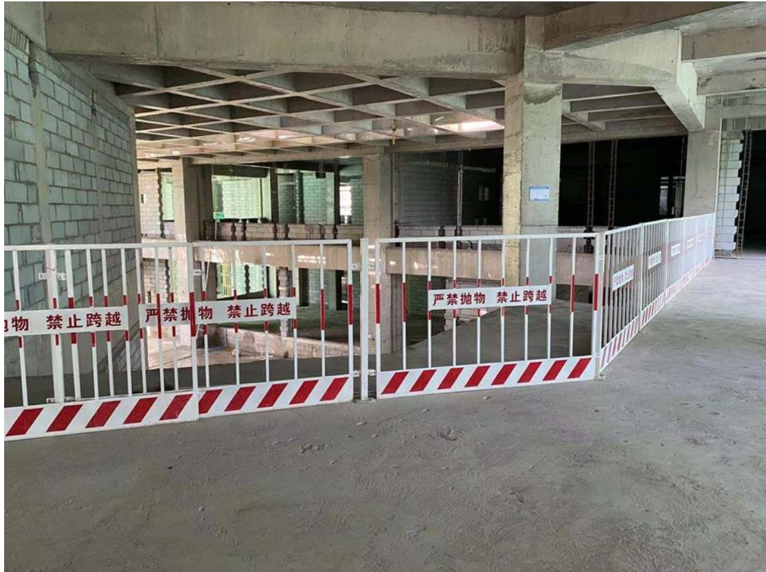
室内临边防护措施

改，并由原检查人员复查确认。增加安全防护设施，特别是“三宝”、“四口”、“五临边”防护设施，确保安全防范措施到位。