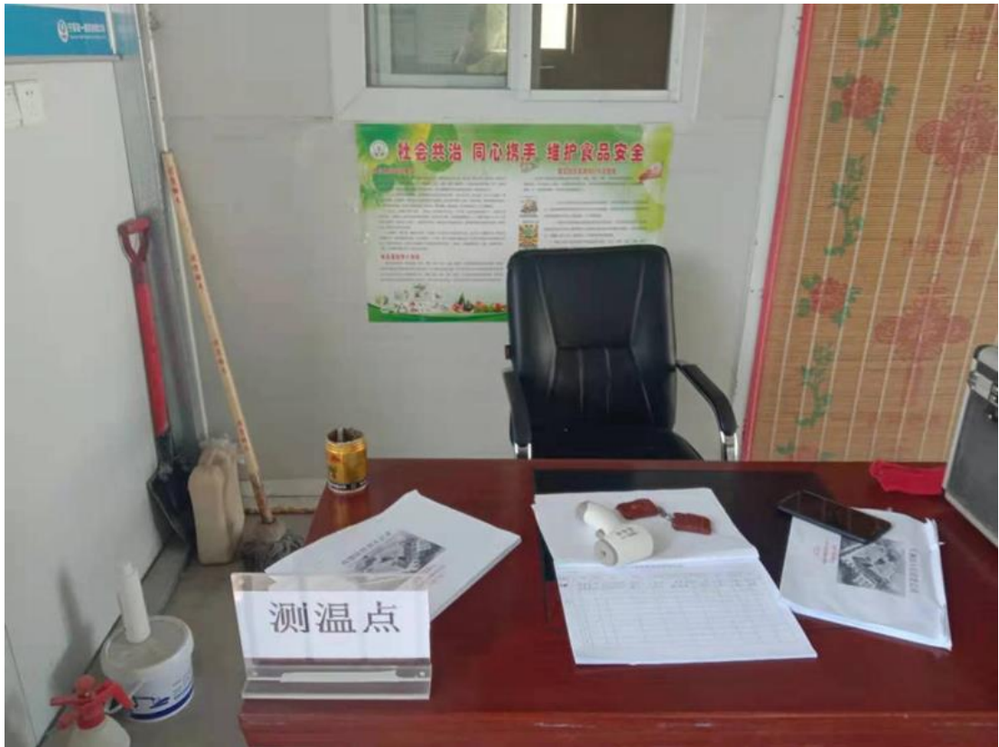
测温及入场登记、消杀物资配备