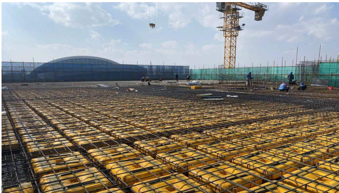
4 段屋盖钢筋绑扎施工

在质量管理方面，我处协助施工单位编制《宁夏大学教学综合楼（未来教室）项目工程创优管理策划方案》，使其作为本工程总体指导施工目标的纲领性文件，创优目标管理贯穿于整个创优全过程；加强施工工序的质量控制，把工程质量从事后检查把关，转向事前控制，达到“以预防为主”的目的。