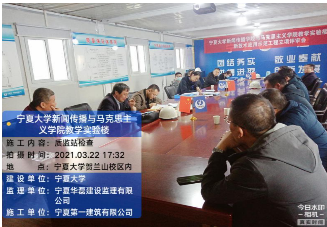
质检站开工检查会议