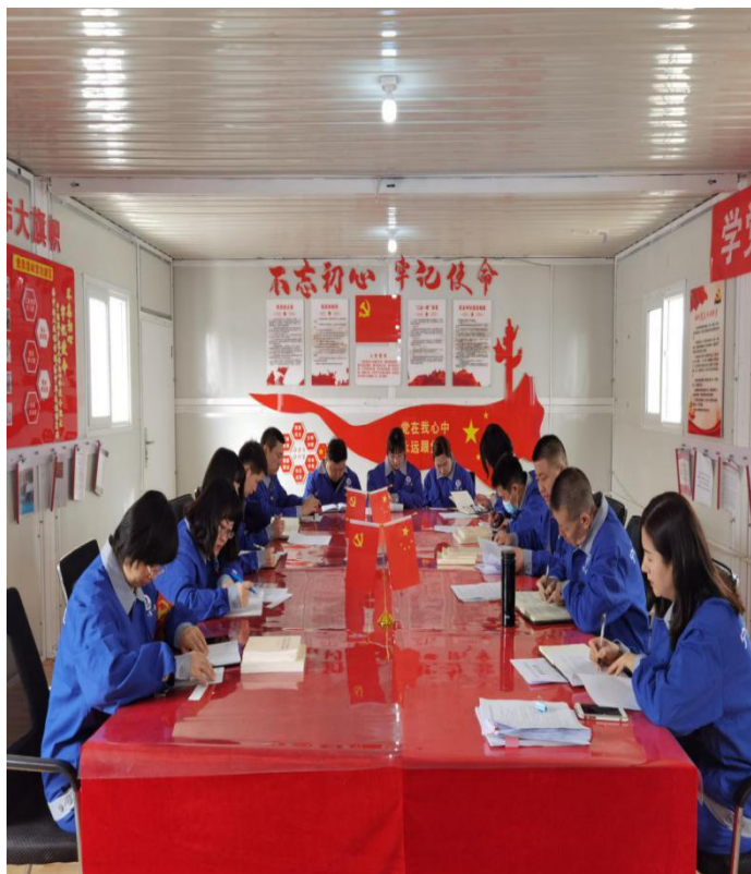
十二分公司党员学习