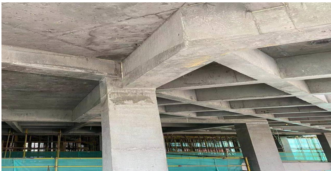
砼成型效果、梁、板交界处线条顺直，棱角方正

在质量管理方面，我处协助施工单位编制《宁夏大学教学综合楼（未来教室）项目工程创优管理策划方案》，使其作为本工程总体指导施工目标的纲领性文件，创优目标管理贯穿于整个创优全过程；加强施工工序的质量控制，把工程质量从事后检查把关，转向事前控制，达到“以预防为主”的目的。