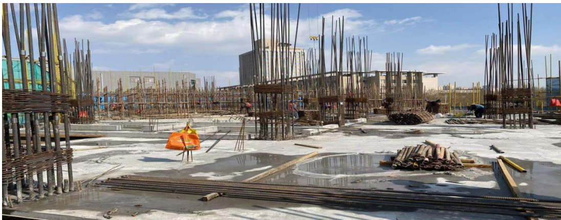
1 段一层楼盖结构砼浇筑完成

教学综合楼（未来教室）项目自今年复工以来，材料准备充足、建筑劳动力充裕、设备运行良好、保证工程质量的同时，加快施工进度，目前完成了 1 段一层楼盖浇筑完成；4 段主体结构封顶；室外消防水池施工完成。