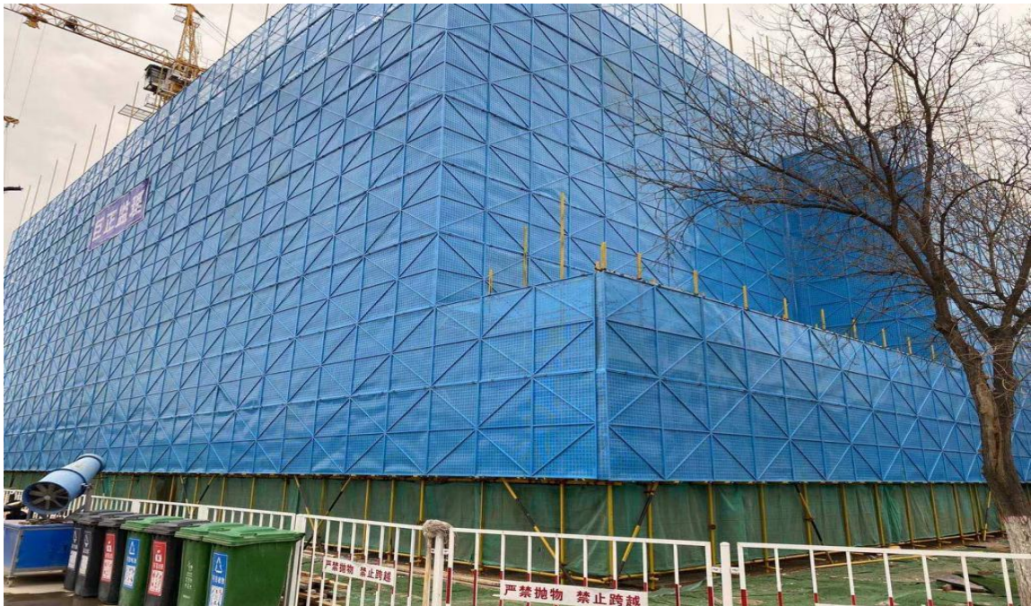
拆除密目安全网安装外架钢板网

我处严格执行银川市住建局《关于做好 2021 年银川市建设工程春季开复工安全生产工作的通知》的要求、督促施工单位全力实施智慧工地建设、加强工人安全生产教育、实行关键岗位人员履职到岗管理制度。每周二组织召开工地例会，参建各方及时沟通，解决问题，对一周的质量、安全、进度问题进行通报，及时整改，确保高效达成项目既定目标。