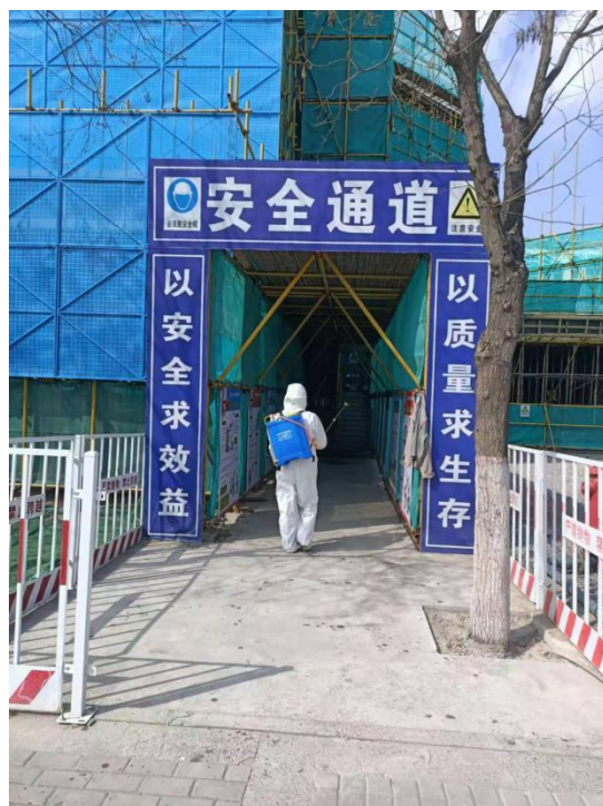
施工现场定期消杀